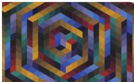
Victor Vasarely: La-Mi. (részlet) 1973. Szerigráfia. Lap az Hommage à J.-S. Bach albumból.

A budapesti Szépművészeti Múzeum – Vasarely Múzeum kiállítása Victor Vasarely (1906-1997) művészetének egyik legjellemzőbb műfajára, a sokszorosított eljárásokkal készült szerigráfiaik és multiplikáik bemutatására fókuszál.